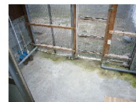
風除室 洗濯機置場↑