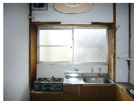
ガスコンロ+キッチン